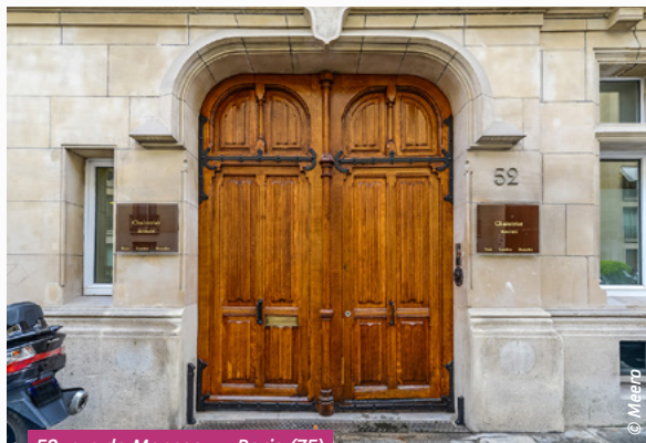
52, rue de Monceau - Paris (75)

La stratégie de votre SCPI sera poursuivie en 2025, à savoir : la modernisation du patrimoine par la conduite de restructurations créatrices de valeur, le recentrage parisien, l'adaptation des immeubles aux enjeux environnementaux et aux nouvelles attentes des utilisateurs.