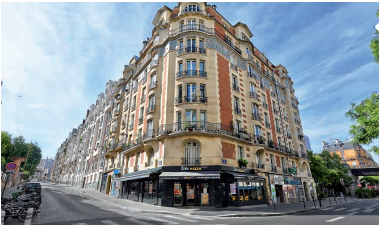
395, rue Vaugirard