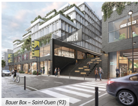
Bauer Box – Saint-Ouen (93)