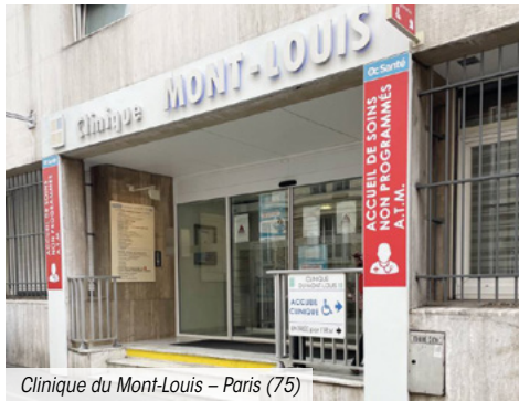
Clinique du Mont-Louis – Paris (75)